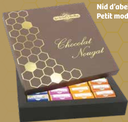
Nid d'abeilles Petit modèle