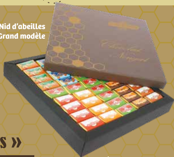
Nid d'abeilles Grand modèle